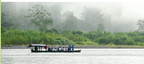
Valle de La Estrella, Talamanca