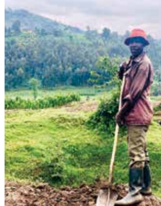
Curage des canaux de drainage dans les plaines de Mugogo.

la diversification des ressources, a amélioré la productivité agricole, la fertilité des sols et les conditions de vie des petits exploitants agricoles.