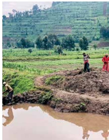
À gauche : Plaines de Mugogo. À droite : Préserver les canaux de drainage (premier plan), aménagement des banquettes sur les collines à l'arrière-plan.