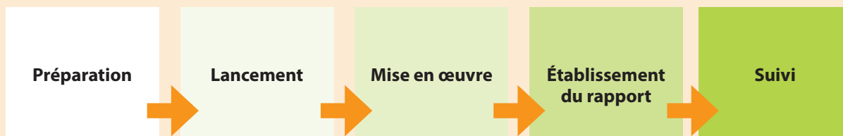
Figure 2 : Calendrier indicatif de l'examen à mi-parcours

1) Phase de préparation : Définir la portée de l'évaluation, rédiger le plan de gestion de l'évaluation, élaborer et diffuser les termes de référence des évaluations (qui donnent un aperçu de ce que l'on attend de l'évaluation), recruter l'évaluateur ou les évaluateurs.